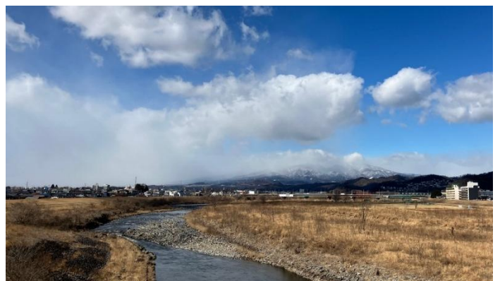
桐生大橋（会場から徒歩 10 分弱）からの眺め、渡良瀬川