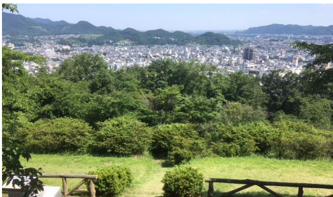
水道山公園からの眺め